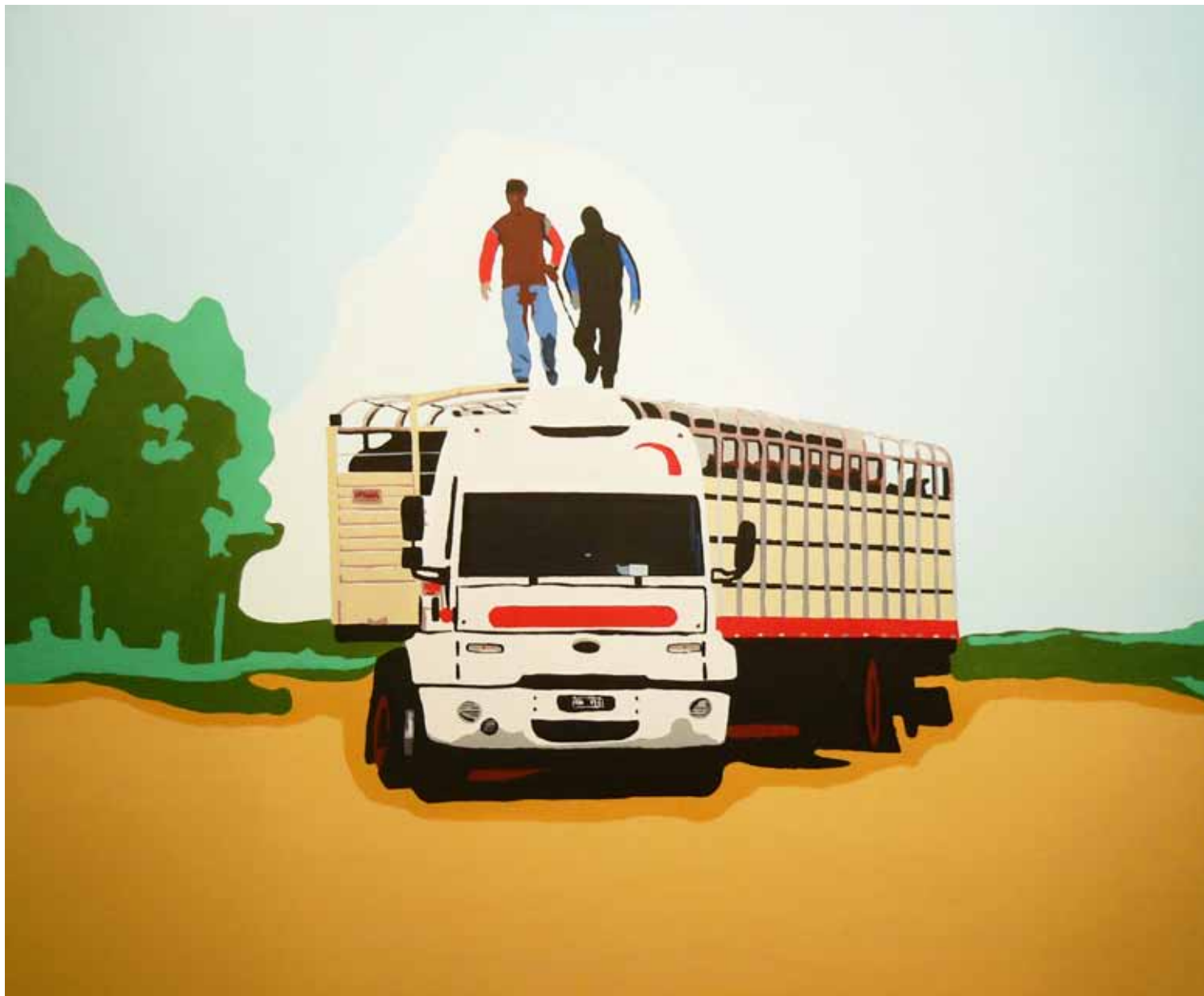
TRASLADO 3-2011 Técnica mixta 100x100 cm