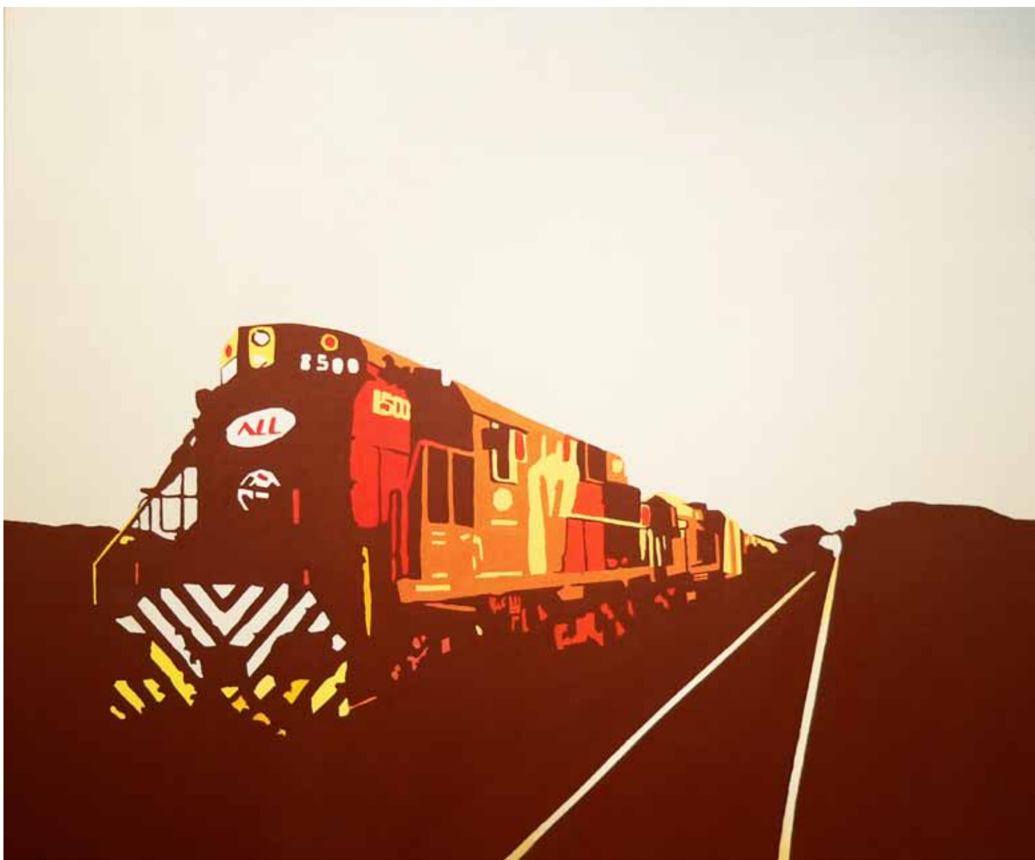
TRASLADOS 2 - 2012 Técnica mixta 120x80 cm cm.