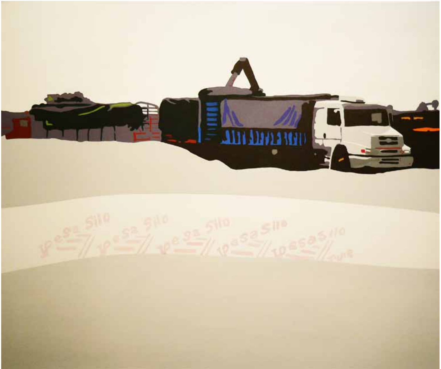
TRASLADOS4 - 2012 Técnica mixta 130x200 cm.