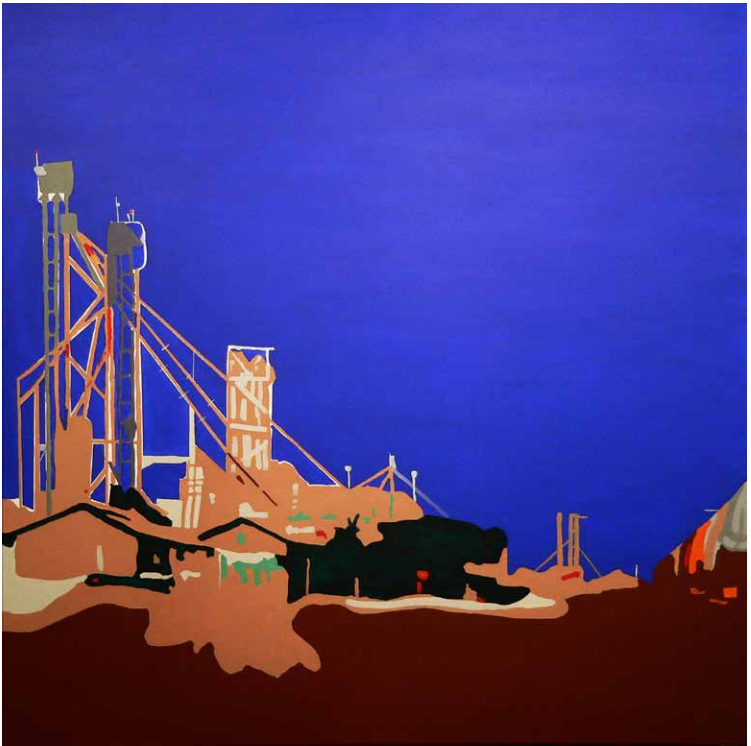
TRASLADO 7 - 2012 Técnica mixta 110x110 cm.